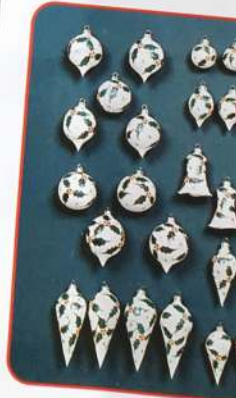
Sb. 36. Sticlă mat alb, decorată cu desen floral rotund/oval ø 45-60-70 mm, con mic, con mare, clopoțel. 36. Sb. White matte glass with flower design assortment, 9 styles: round/oval ø 45-60-70 mm, form small cone, big cone, bell.