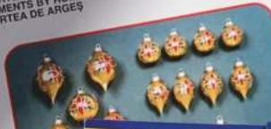
ORNAMENT HAND DECORAT