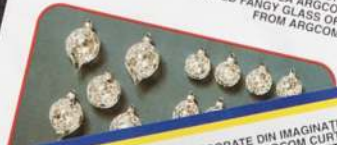
ORNAMENTE DIN STICLĂ DECORATE DE CĂTRE MAIESTRII DE LA ARGCOMS - SOCOM CURTEA DE ARGES HAND DECORATED FANGY GLASS ORNAMENT ASSORTMENTS BY FROM ARGCOMS - SOCOM CURTEA DE ARGES