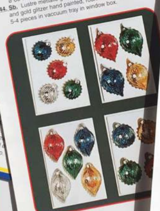
Sb. 344. Sticlă cu lacuri și glitter colorate ø 60-70 mm, 5-4 piese în cofraj și cutie 344. Sb. Glass with lacquers and color round/oval ø 60-70 mm, 5-4 pieces in window box.