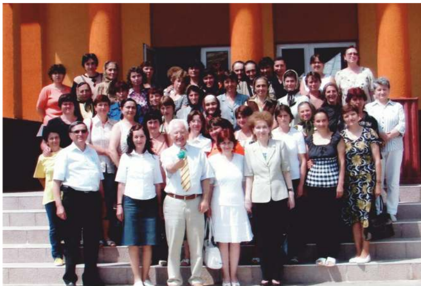
Echipa de management, parteneri, lectori și cursanți ai POSDRU (Programul Operațional Sectorial Dezvoltarea Resurselor Umane) la finalul proiectului