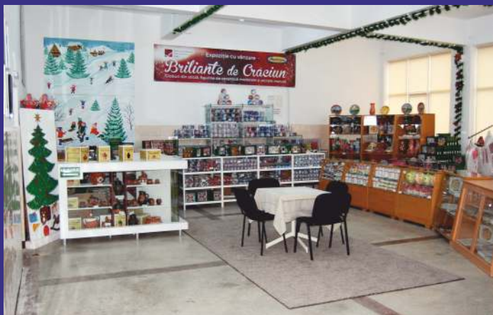
Magazinul de fabrică