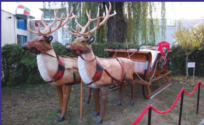
Sania cu renii lui Moș Crăciun