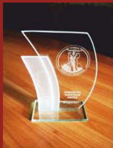
Trofeul "Fabricat in Arges"