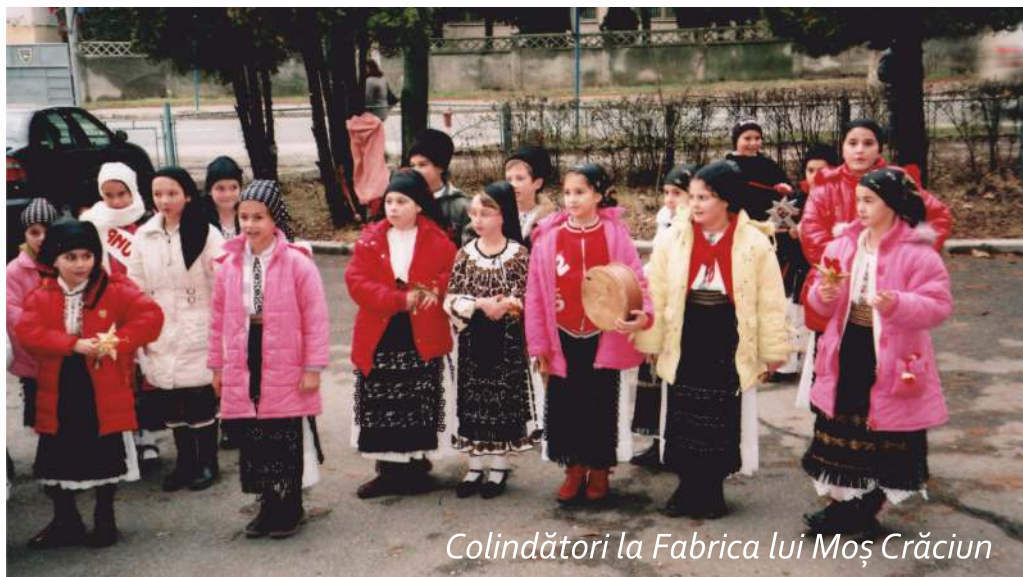
Colindători la Fabrica lui Moș Crăciun

"Crăciunul este ziua care ține timpul împreună", spunea acum aproape două secole poetul scoțian Alexander Smith. Deodată, întreaga Creație s-a redefinit pe sine pentru a ține timpul împreună, precum în colindul nostru: "Astăzi S-a născut Hristos, /Mesia chip luminos, /Lăudați și cântați! /Și vă bucurați!" A ține timpul împreună presupune, tainic, deopotrivă comuniune, pace, puritate și bucurie.