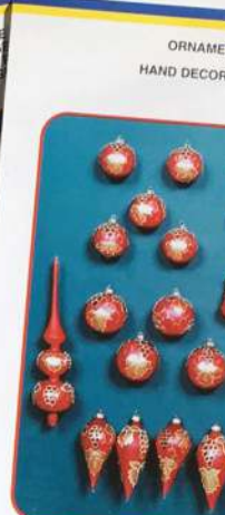
ORNAMENT HAND DECORAT