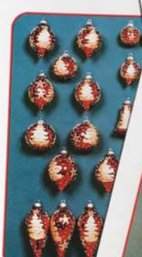
Sb. 14. Sticlă metalizată glitter galben, 9 forme con mic, con mare, 14. Sb. Red lustrous gold glitter hand painted round/oval ø 45-60-70 mm, big cone, bell,