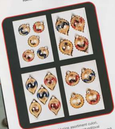
Sb. 44. Sticlă metalizată lucios asortiment de culori, decorat cu bronz și glitter galben, rotund/oval ø 60-70 mm, 5-4 piese în cofraj și cutie cu ferestre. 44. Sb. Lustre metallic glass color assortment, with bronze and gold glitter hand painted, round/oval ø 60-70 mm, 5-4 pieces in vacuum tray in window box.